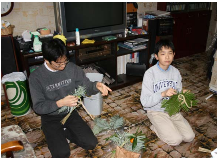
ちよろけんの製作 この伝統は引き継ぐ(子供談)

3. 上記にさらにはつきみかんを1個真ん中に、水引でゆわいつける。葉は多すぎる場合は切り取る。最後に水引を蝶結びとして完成。