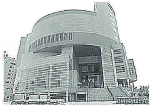
高知市文化プラザ