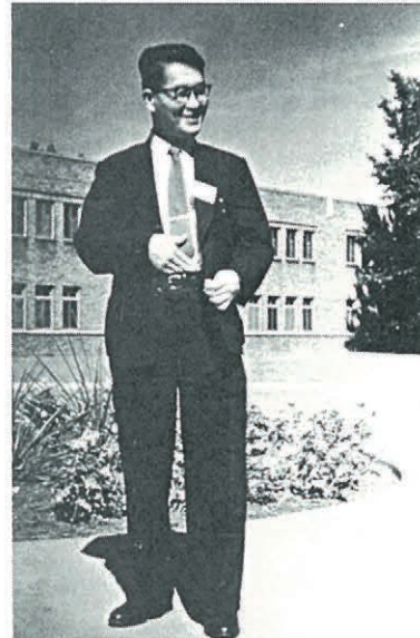
好評だった学会発表をおえて (1958年頃)

(2) 川上正澄 (1961) 脳の働きと性ホルモン、科学 31, 405-411.