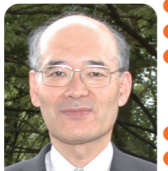
理事長: 高田 邦昭 (2012年1月1日現在)