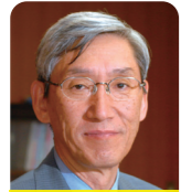
理事長：菅村 和夫 (2012年1月1日現在)