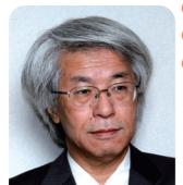
理事長: 近藤 孝男 (2012年1月1日現在)